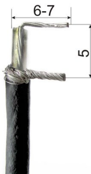
Рисунок 2 – Разделка кабеля соединительного